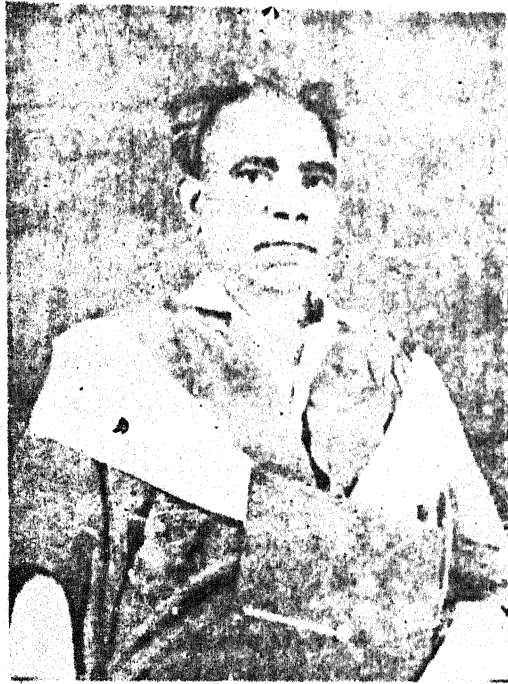
(क्रान्ति से डाॅक्टरेट तक)